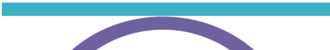
Komise pro udělování Oprávnění a Osvědčení k provádění prohlídek mostních objektů na pozemních komunikacích

P.3.1.5 KOMISE MD-prohlídky mostů používá pro účely záznamů, zápisů, protokolů či styku s MD a s jinými orgány a organizacemi vlastní barevné logo s nápisem „Komise pro udělování Oprávnění a Osvědčení k provádění prohlídek mostních objektů na pozemních komunikacích“, které je uvedeno na obr. 1.